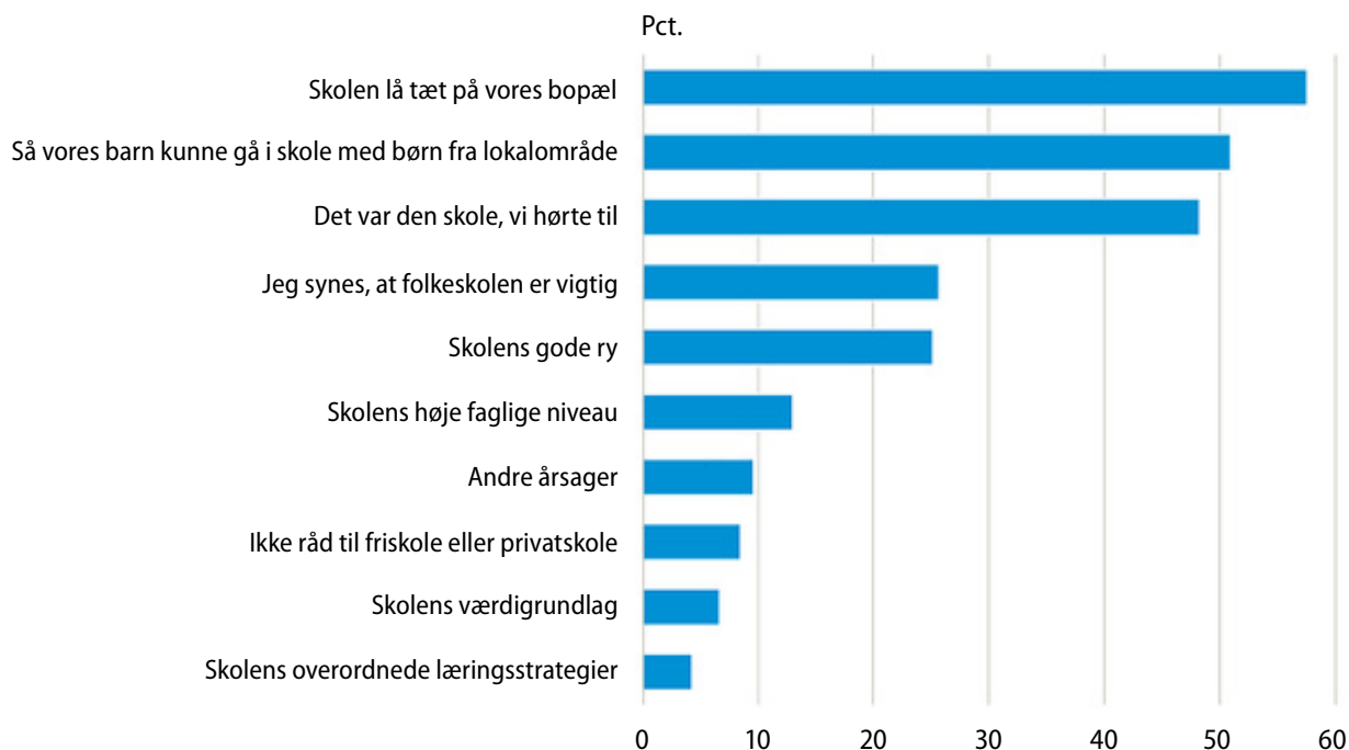
Figur 3: Forældre til børn i folkeskoler: Hvorfor valgte du netop den skole, som dit barn går i?

altså folkeskolen fra og friskoler og private grundskoler til, når de skal tage stilling til, hvor børnene skal lære deres ABC og meget andet.